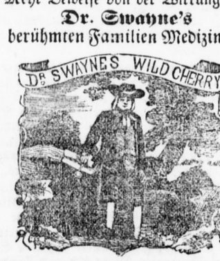
DR. SWAYNE'S WILD CHERRY

Kur folgt auf Kur! Mehr Beweise von der Wirkung von Dr. Swayne's berühmten Familien-Medizinen.