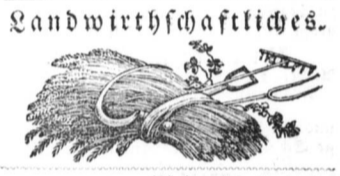
(Für den „Lecha Patriot.“)