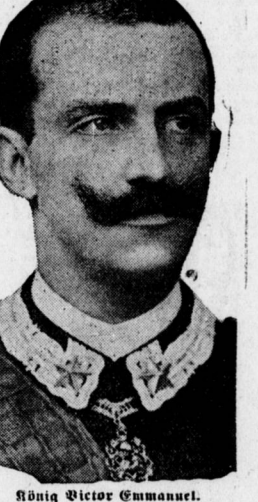
König Victor Emmanuel.