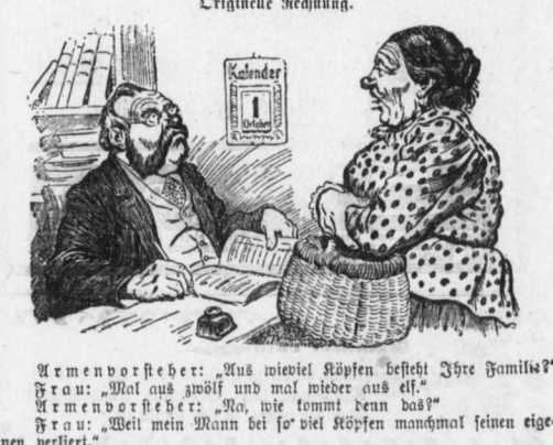
Armenvorsteher: 'Aus wieviel Köpfen besteht Ihre Familie?'

Fatale Parallele. Konzeptionsfängerin (die in einer fremden Stadt einen Lumbmann gefunden): 'Sie erinnern sich sogar genau an meine Taufe?'