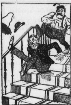
Der Pisp, das arme Schneiderlein, brüht eine Gals beim reichen Klein...