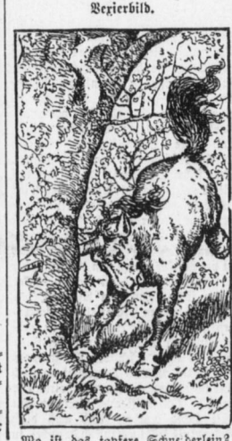
Wo ist das tapfere Schnurbeinlein?

Ein Fälschen. 'Onte!, soll ich Dir De'ne Ringe aufgeben?' 'Aber, Hansi, das geht doch nicht; die unteren sind Klein, die oberen groß...'