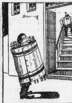
Der Teppich nämlich hü: Pisp ein Wie ein gepanzerter Ritterlein...