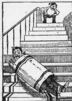
Der mitleidlose reiche Klein; indes das arme Schneiderlein Selbsttätig immer weiter rollt...