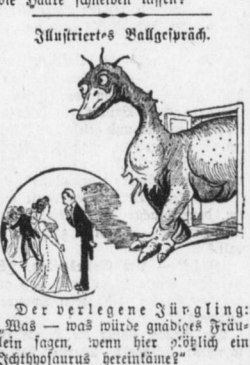
Der verlegene Jüngling.

Des halb. 'Das Viehste am ganzen Tag ist mir doch das Mittags-schlafchen.'