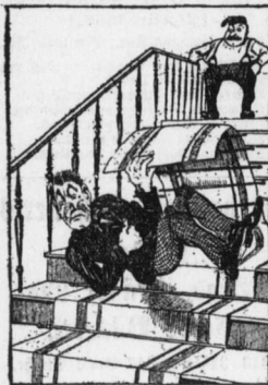
Pisp löst in seinem großen Schred Den Teppich an und reißt ihn weg...