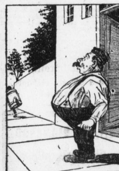
Schodas das büre Schneiderlein Ist stüfter als der bide Klein...

Ein Kenner. U. (im Konzert zu seinem Nachbar): 'Wie hat Ihnen das Violinterzett gefallen?'