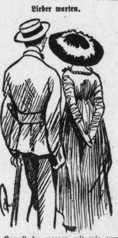
„Kannst du morgen mit mir zum Juwelier kommen, Schatz? Ich möchte gerne, daß du dir deinen Verlobungsring selbst ausstückst.“

Wir sind seit Ausbruch des Krieges von Europa abgeschnitten. Wo gibt es bei uns Maschinen, Instrumente, komplizierte Heilmittel?