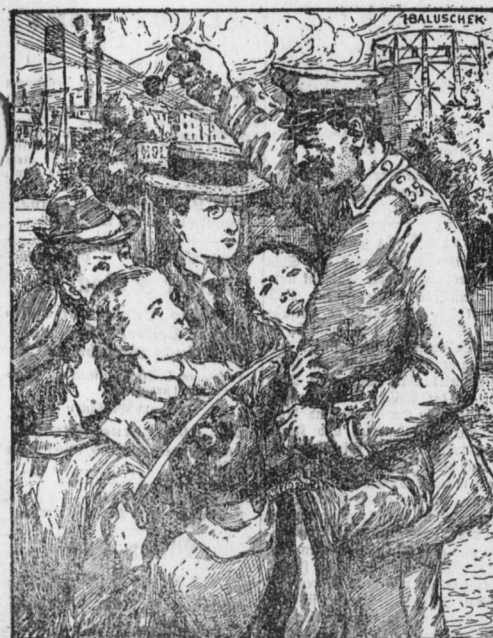
„Also — wie jagst — Jung — da kriechen wir es mit de Wirt!“