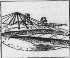
Französischer Bange-Eindecker mit Rastmaschinengehör...