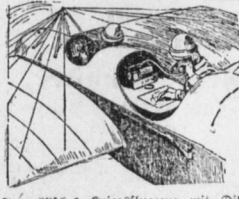
Französisches Kriegsfugzeug mit Diktierapparat im Beobachteritz.