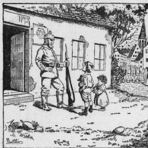
„Wo ist dein Vater?“