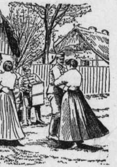
„Wo ist dein Vater?“