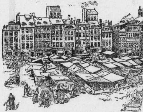
Altmacht in Warschau.