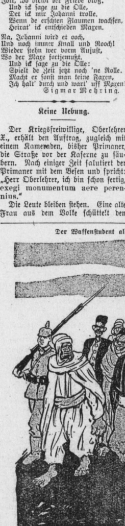
Der Audmajor der Wäcker: „Pst, Deutell und das sollen — — Dieckelge Wegner sein!“