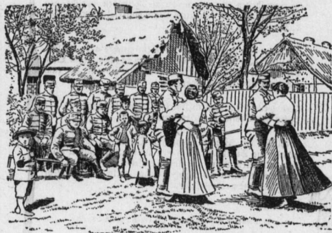
Ein Sonntag der österreichischen Husaren in Russisch-Polen.