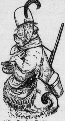
Der Herr Rentier.

„Nun, Herr Professor, wie sind Sie denn mit Ihrer jungen Frau zufrieden?“ „Ungherodentlich, meine Herren, hauptsächlich im Lalein und Griechisch.“