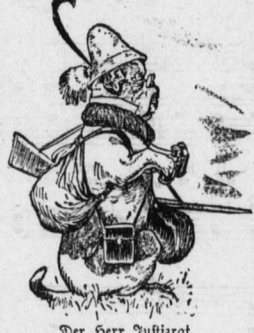
Der Herr Justizrat.

Schlimm. Richter: „Sagen Sie, wo lernten Sie den Angeltoggen kennen?“ Kläger: „Er suchte in der Zeitung einen Associs zweets Ausbeutung einer — Erfindung.“ Richter: „Ja und dann?“ Kläger: „Und dann! — Die Erfindung war ich!“