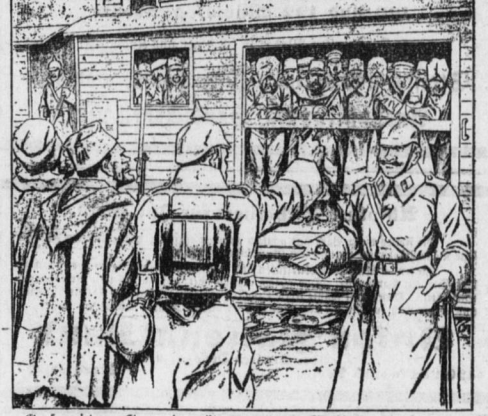
Gefreiter: Genga da nüt no paar Gurthas und Zuaben ne? Feldwebel: Bedauere, der Mustertoffen ist voll!

Uebertrumpft. „Ich kannte einen Schauspieler, der spielte den Franz Moor so realistisch, daß er jedesmal selbst vor sich bange wurde.“ „Das ist noch gar nichts; ich kannte einen, der erdroßelte sich als Franz Moor jedesmal — wirklich!“