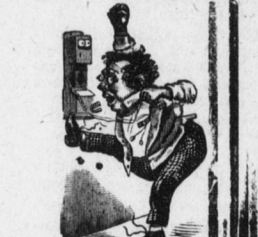
Die Telefonnummer des „Wochenblatt“ ist jetzt 2309 (neu).

Wohnung, 203 Spruce Straße. Die fünfeinzigjährige Amanda (aus dem Theater zurückkehrend) Mutter, das war ein herrliches Stück! Alle Mädchen belamen Männer.