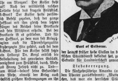
Earl of Selborne.

Die Landwirtschafstaktik im britischen Koalitionskabinet. Als vor kurzem das neue Koalitionsministerium in England gebildet ward, wurde der Earl of Selborne, der Earl of Selborne, als Landwirtschaftssekretär im britischen Koalitionskabinet ernannt.