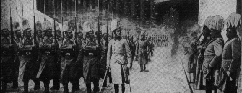
Imperial Guard Passing in Review Before their Emperor-War having just been declared

To All Americans Before you pass judgment on Germany, learn what German Culture means. The literature of Germany since Goethe is unsurpassed and perhaps unequalled by that of any other country.