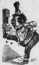
Die Telefonnummer des 'Wochenblatt' ist jetzt 2309 (neues).