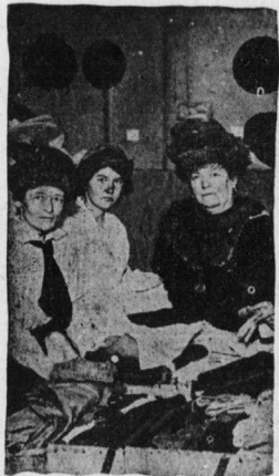
Für die Kriegsgroßleidenden.

Dieselbe scheint weit größer zu sein als die in Berlin. Die Wiesenstadt London hat zu jeder Zeit eine größere Zahl von Armen als irgend eine andere Stadt der Welt.