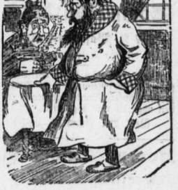
Das ist ein Postkötener, ein Mann, der die Briefe bringt...