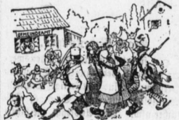
Das ist ein Postkötener, ein Mann, der die Briefe bringt...