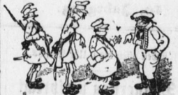
Das ist ein Postkötener, ein Mann, der die Briefe bringt...