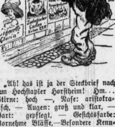
Ab! das ist ja der Stadtbrief nach dem Hochpater Horstheim! Am... Stine: hoch - Auf: aristokratisch - Augen: groß und klar - Wort: gepflegt - Gesichtsfarbe: Vornehme Blässe - Besondere Kennzeichen: tritt sehr elegant auf - Am, so eener schein en Stadtbrief möcht ich auch mal hinter mir drein haben!