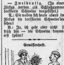
„Zweideutig. (In einem Zirkus werden als Schlughnummer dressierte Schweine vorgeführt.)“ „Sie wollen sich heute eben im Zirkus die dressierten Schweine anschauen?“ „Ja, ich gehe aber nicht so früh hin — die Schweine kommen erst später!“