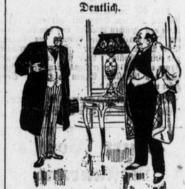
„Sie wollen einen so hohen Betrag von mir, was bieten Sie mir als Sicherheit?“ „Gnädig! Ihnen das Wort eines Ehrenmannes!“ „Ja wohl, bringen Sie ihn nur her!“

Der Arzt beim Zahnarzt. „Nun, Herr Kugler, wie war's denn gestern beim Zahnarzt?“ „Der Arzt berührte kaum den Zahn... im selben Augenblick war er auch schon draußen.“