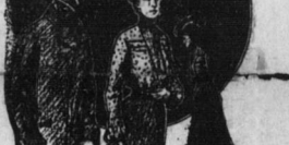
Hält man Ihre Ruffine für hübsch? Noch nicht, erst wenn ihre steirische...