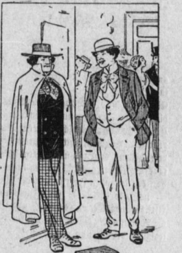
Romiker (um Schauspielers, knapp vor dessen Benefiz-Vorstellung...)