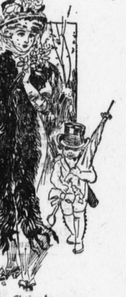
im modernen Geinande.