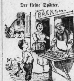
Der kleine Spötter.

Die Frage wußt ich, um sich einen Überlebens zu schaffen.