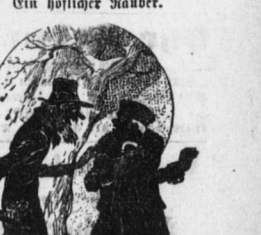
Wegelagerer (am Eingang vom Wald zum Spaziergänger): „Der Weg durch den Wald ist gefährlich, mein Herr...“