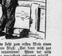
Der Herr Professor, Herr Professor, sind in Ihrer Schule Schillerförmige vorgekommen?