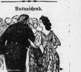
Dame: Sie haben jetzt meine Stimme gehört, Herr Professor...

„Aber wenigstens will ich jetzt mit Paul sprechen, um seinen Namen zu erfahren.“