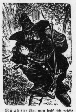
Der Hund des Betrügers.