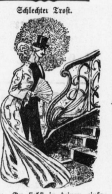
Schlechtes Trost. Er: Du siehst in deinem einfachen Kleide wirklich hübsch aus! Sie: Es fehlt aber eigentlich noch ein leichter Stoff dazu, zum Darüberziehen.

Wittenberg. Am 18. Juni findet hier die Entführung des Denkmals Kaiser Wilhelms statt. Gießen. Die Strafkammer in Gießen verurtheilte den Kaufmann Sobolik zu 54,000 Mark Geldstrafe.