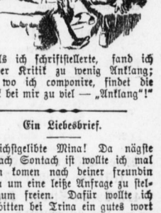
Immer daneben. Als ich schriftstellernde, fand ich bei der Kritik zu wenig Anklang; jetzt, wo ich componire, findet die Kritik bei mir zu viel — „Anklang!“