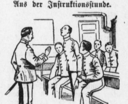
Unteroffizier (zu einem ein- fältigen Rekruten): Sie Dohse, wenn Ihnen endlich mal ein Licht aufgeht,

Ein moderner Freier. „Hat einer von den Mannschaften“, fragte der Herr Stabsarzt bei der Unteroffizier zu einem ein- fältigen Rekruten: Sie Dohse, wenn Ihnen endlich mal ein Licht aufgeht,