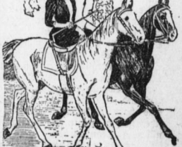
Ein moderner Freier.