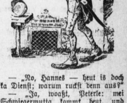
Ein moderner Freier.