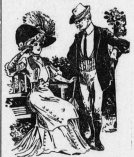
An Ihrer Stelle, mein Fräulein, würde ich mir dieses Theaterstück auf keinen Fall ansehen, es ist unsittlich. — "Aber es steht doch ausdrücklich da — 'Sittenschild'!"