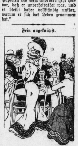
Dame: Ist dieser Stuhl noch frei, mein Herr? Herr: Gemüth gnädiges Fräulein, der Stuhl und — ich auch.

Aus der Artgeschichte. Oberförster: Na, Herr Förster, wie sind Sie denn mit dem neuen Eichen geländen? Förster: Forst, Herr Oberförster. Oberförster: Wieso denn, ist er nicht auf dem Posten? Förster: Des ich, Herr Oberförster. Oberförster: Na also, was haben Sie denn an ihm auszufragen? Förster: "J. wissen S., ma kann sich ja mit dem Walfisch gar nirtend sehen lassen — der redt ja immer de Wahrheit!"