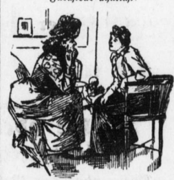
Mutter: 'Findet Ihr meine Photographie ähnlich?' Tochter: 'Sehr ähnlich! Mein Mann ist förmlich erschrocken!'