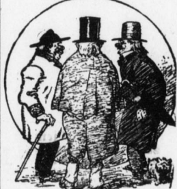
„Gabi's scho" gehört — 'n Steffen-Loni sein Heißel hat der Schnee 's Dach eindrudt!... „Das wundert mit gar net — wo a' noch so viel Hypothek'n drauf laßt'n!"

Wissensdrang. Ein Parvenü, bei dem das Ansehen der Bildung nicht mit dem des Geldes gleichen Schritt gehalten... Mein Wunder. Ein bißchen anders. 'Ja, mein Sohn, ich verdanke mein Glück dem Aufheben einer Nadel...'