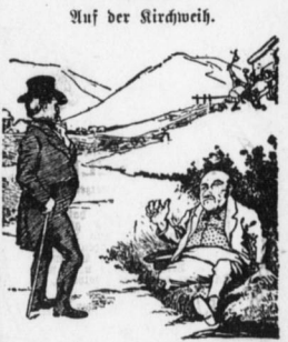
„Armer Mann, nicht einmal ein Holzeisen können Sie sich anschaffen?" „Doch; aber die wilden Burschen da brauchen's beim Raufen."

— Beweis. Schwiegermama: „Gott! mit mein Schwiegerohn etwa heimlich lieben?" — Onkel: „Wie kommen Sie darauf?" — Schwiegermama: „Er laufst, so oft er mich ansieht!"