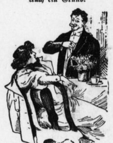
Sie machen mit Ihrem Gatten niemals eine Bergungsfahrt? Nein, bei diesem Tage ich zu kurz Franz würde dann stets die Begenden flatt mich beunruhigen.

Text at the bottom of the page, possibly a continuation or footer.