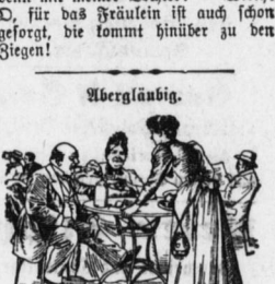
Ein biederer Landpflafer war zu einer kleinen Feier der Müdigkeitserklärung eines Sohnes des Rittersguts - Meisters eingeladen.