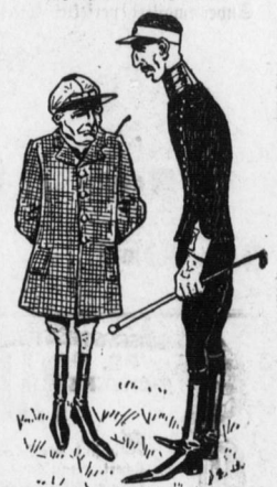
Ein biederer Landpflafer war zu einer kleinen Feier der Müdigkeitserklärung eines Sohnes des Rittersguts - Meisters eingeladen.

Wittenberg. Hier fand das 55jährige Stiftungsfest des landwirthschaftlichen Lokalvereins, verbunden mit Bierfest und Verloofung statt.