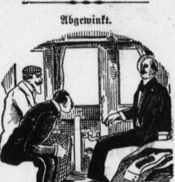
Ein biederer Landpflafer war zu einer kleinen Feier der Müdigkeitserklärung eines Sohnes des Rittersguts - Meisters eingeladen.