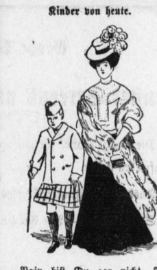
Kind von heute.