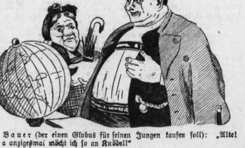
Bauer (der einen Globus für seinen Jungen kaufen soll): "Alte! nur a anzigeimä! möcht ich so an Knödel!"

Zeenverband. Sohn (zu seinem Vater): "Du, Papa, jetzt brauche ich noch eine Naturgeschichte und einen neuen Atlas."