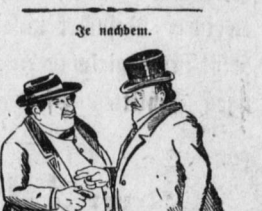
Er: 'Wer war denn der ungeschliffene Bauer, mit dem du vorhin sprachst?' Da: 'Das war der dieselbe Millionär und Rittergutsbesitzer.' Er: 'Was, so ein feiner Mann?'