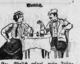
Er: 'Ehlich gesagt, mein Fräulein, ich werde wahrscheinlich nie heirathen.' Sie (entsetzt): 'Was! Und mit derartigen Absichten wegen Sie es, mich zu einem Ausfluge einzuladen!?'