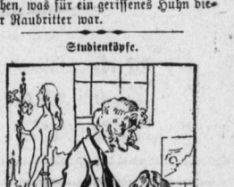
— Hinausgegeben. Student Raufmeier (während zu seinem Wirthshaus-Bisais): Herr, ich verbitte mir, daß Sie bezüglich meine Raubritterfiguren! Gott! (lebenswüthig): Aber, mein Herr, ich kann doch gar nicht unter 'en Tisch sehen.