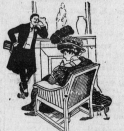
„Ich will Ihnen, gnädiges Fräulein, eine Jagdgeschichte erzählen...“

„Genau 1-6 Millimeter? Das läßt... Die summe Gräfin. „Genau 1-6 Millimeter? Das läßt... Die Gräfin sah den Mann, der sie in den Salon führte.