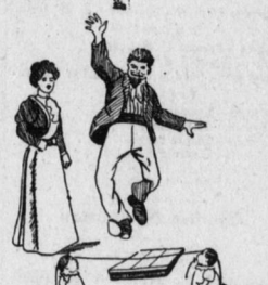
„Donnerwetter, mit 50 Jahren springen Sie noch 2 Meter hoch? Wie haben Sie denn das erreicht?“