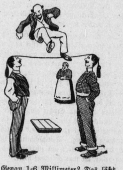
„Genau 1-6 Millimeter? Das läßt sich ja gar nicht machen?“