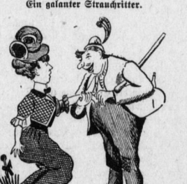
Ein galanter Strauchritter.