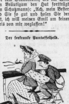
Der seckante Pantoffelheld.