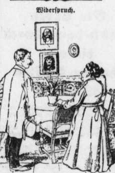
Fremder: „Wen stellt das Bild über dem Kamin?“