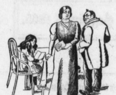
Ihr Töchterchen, Herr Commerzienrath, hat sehr gute Anlagen...