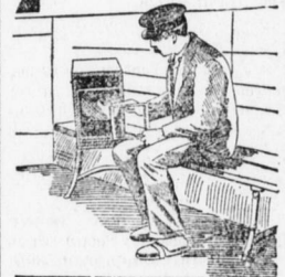
Das Einsetzen der Kämmchen.