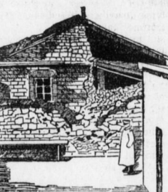
Gebäude des alten Stadttheaters...