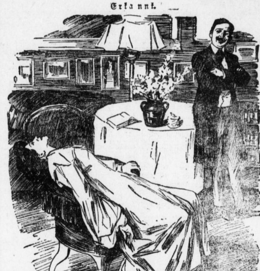
„In diesem Monat, liebe Klara, fällt...