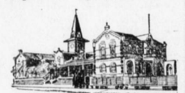
Bahnhof in Swakopmund.