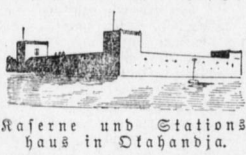
Kaserne und Stationshaus in Otahandja.