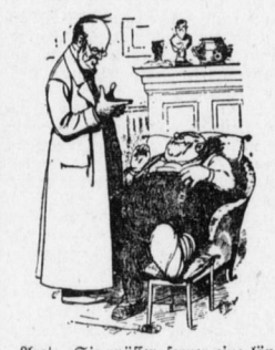
Arzt: „Sie müssen ferner eine längere Trinkturst durchmachen.“