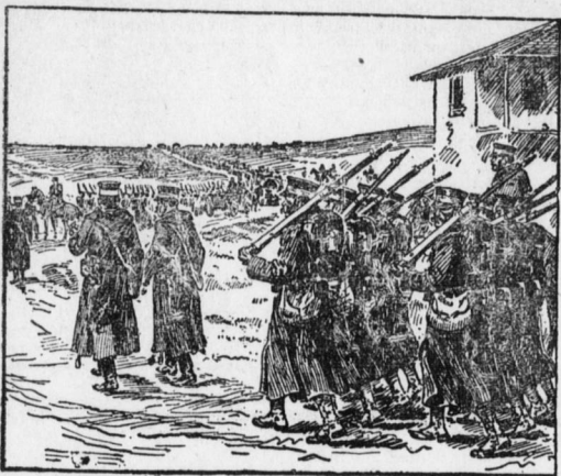
Japanische Infanterie auf dem Einmarsch in Korea.