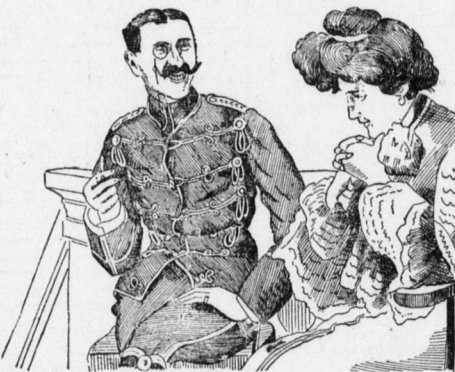
Leutnant: „Ja, gnädiges Fräulein, man erregt eben überall Bewunderung...“

— Angewandte Redensart. art. Junger Mann (trifft auf dem Heimweg...)