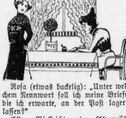
Kosa (etwas buckelig): „Unter welchem Kennort soll ich meine Briefe, die ich erwarte, an der Post lagern lassen?“