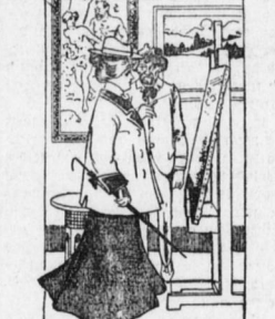
Das Bild wird meine Mama kaufen...