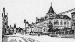
Die Hohenzollernstraße in Tjingtau.