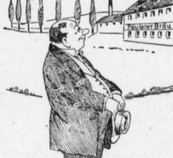
„Es ist merkwürdig: ich mag hingehen wo ich will — immer kommt' ich schließlich zum Salvatoreller!“