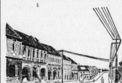
Verlängerte Friedrichstraße im Stadtteil Tapaupau.