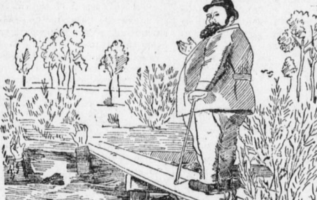
„Hilfe, Hilfe — ich kann nicht schwimmen — — —“

— Vorsichtig. (Schusterjunge zum Studenten): „Hier bring' ich die Rechnung...“