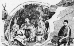
Herero vor ihrer Hütte; Vorbau und Eingang.