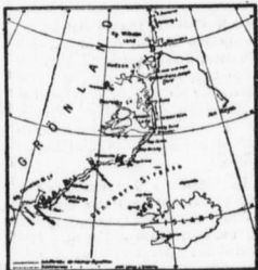
Stizze der Reise.

In Angmagssalik, wo in mehr oder weniger großem Abstand voneinander ein Estimo-Stamm wohnt, der etwa 400 Köpfe zählt, errichtete Dänemark im Jahre 1894 eine Handels- und Missionsstation, so daß Niemand mit den Eingeborenen in geschäftlichen Verkehr treten darf, außer dem „königlichen grönlandischen Handel“ in Kopenhagen, der das Handelsmonopol für alle unter dänischer Oberhoheit stehenden Colonien in Grönland besitzt. Die dänische Verwaltung verkauft den Eingeborenen leinen Tropfen Branntwein, ja kaum europäische Nahrungsmittel, sondern ausschließlich zu erhalten. Die Estimo sind wacker und sind zum Theil wohl noch jetzt Heiden. Wer ein tüchtiger Fremdermann ist, d. h. gut Robben zu erlegen versteht, und somit ein gutes Auskom-