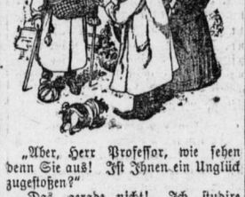
Aus der Praxis.

Ein Opfer seines Berufes. 'Aber, Herr Professor, wie sehen denn Sie aus? Ist Ihnen ein Unglück zugefallen?'