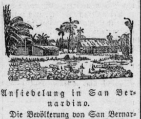
Ansiedlung in San Bernardino.