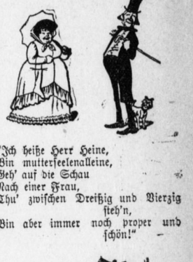
„Ich heiße Herr Heine, Bin mütterleienalleine, Geh' auf die Ehe Nach einer Frau, „Zhu“ zwischen Dreißig und Vierzig...