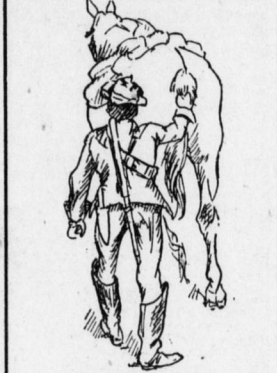
Labung auf dem Marsche.