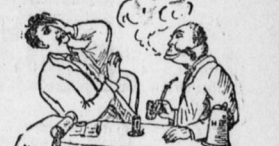
Ben Sie mit doch lieber wieder den...