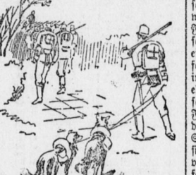
Deutschland. — Auf dem Marich.