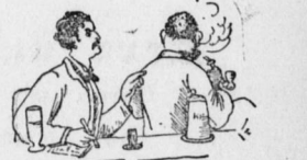
Die schönere Seite.