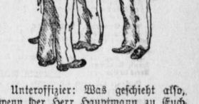
Unteroffizier: Was geschieht aso...