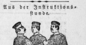
Aus der Instruktion...