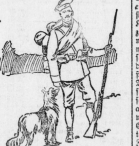
Rußland. — Auf Posten.