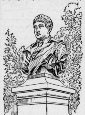
Das Friesendenkmal in Magdeburg.

Mit dem vor Kurzem auf dem „Friesenwall“ in Magdeburg entworfenen Denkmal Friedrich Friesen ist ein dem besten Sohne Deutschlands ein Erinnerungszeichen gesetzt worden. Geboren im Jahre 1785, nach anderen 1784, als der Sohn des Hofbuchhalters Friesen in Magdeburg, wurde Friedrich Friesen nach dem frühen Verluste seiner Eltern unter der treuen Fürsorge seiner zweiten Mutter emporgewacht sich 1805 nach Berlin, um das Baufach zu studiren, wurde aber durch die Gewalt der 1807 an die deutsche