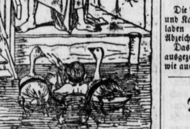
Ein Milderungsgrund. Richter: „Allo Sie haben dem Huberbauer ein Bierglas an den Kopf geworfen?“