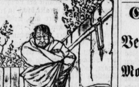
Ein Milderungsgrund. Richter: „Allo Sie haben dem Huberbauer ein Bierglas an den Kopf geworfen?“