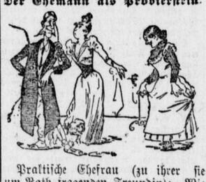
Praktische Ehefrau (zu ihrer sie um Rath tragenden Freundin):

Altkorpe: Also glücklich wieder zurück, alter Junge, von deinen langen Reisen! Du mußt aber auch viel gesehen und viel erlebt haben!