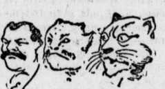
Wie es dem Tiger erging, als auf dem Convent in Chicago zur Abstimmung über Hill oder Cleveland gelaufen wurde.