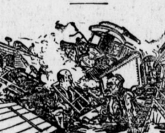
Hill: Himmelhochschwere! Dana: Kreuzbonnenwetter! War das aber ein Knall und ein Krach! Von Glück können wir noch sagen, daß wir mit dem Leben davon gekommen sind!