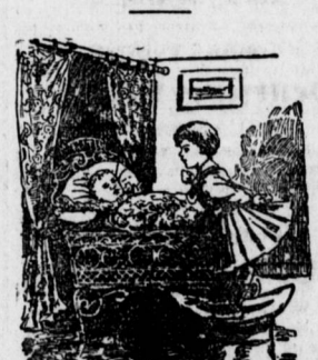
„Aus der Kinderstube der Normannen.“