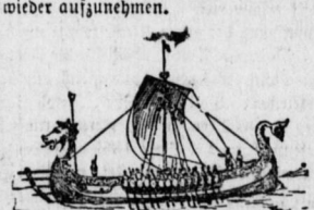
Die Wingerrfahrt zur Weltausstellung.