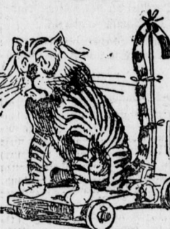
Nach der Abstimmung in Minneapolis.