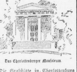
Das Charlottenburger Mausoleum.

Abraham Lincoln liegt bekanntlich in Springfield, Ill., begraben. Er fiel der Kugel des Mordmörders am 15. April 1865 zum Opfer. Die Leiche