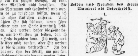
Seiden und Freuden des Herrn Wampert als Velocipedist.