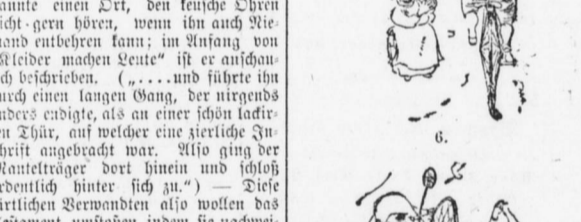
Seiden und Freuden des Herrn Wampert als Velocipedist.