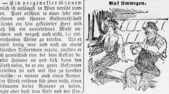
„Fräulein, haben Sie noch Eltern?“ — „Einer nein!“ — „Hat Ihr seliger Herr Papa gerandt?“ — „Ja, er war passionierter Raucher.“ — „Fräulein haben noch Geschwister?“ — „Ja, mein Herr, zwei Brüder.“ — „Die rancosen nicht?“ — „Doch — besonders der Ältere.“ — „Na, das freut mich — da werd' ich mir gleich ein Cigarret anfechten!“