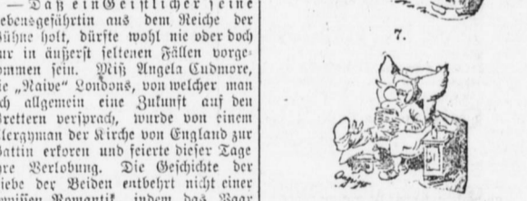
Seiden und Freuden des Herrn Wampert als Velocipedist.