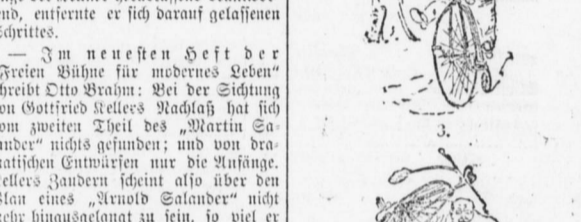
Seiden und Freuden des Herrn Wampert als Velocipedist.