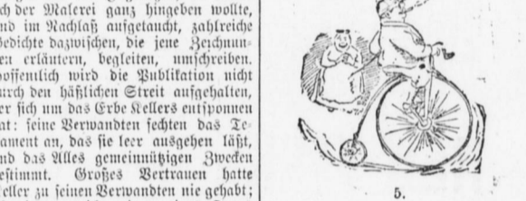
Seiden und Freuden des Herrn Wampert als Velocipedist.