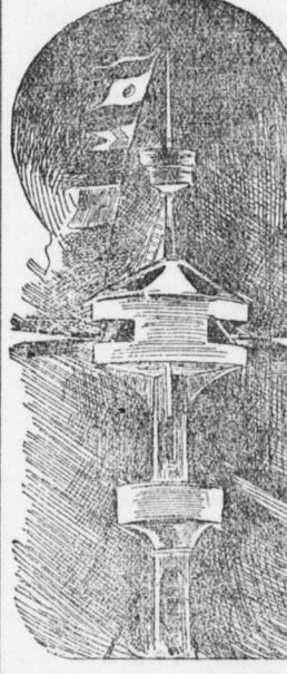
Anser Bild stellt den Mast eines modernen Kriegsschiffes dar mit Auslug und Thürmen. Der Mast ist hoch und von genügend Umfang, um einem Matrose zu gestatten, darin auf- und niederzusteigen.

Schon im Jahre 1338 wurde Schießpulver in der Kriegsführung verwendet und noch im selben Jahrhundert wurden eiserne Geschütze mit verdrängten Kammern gegossen.