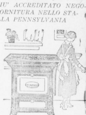
Grande assortimento di stufe a gas e carbone di tutti gli stili.

RAPPRESENTANTI DELLE MIGLIORI CASE DI VICTROLA, PIANI E PIANOLE CHE SI VENDONO ANCHE A RATE SETTIMANALI