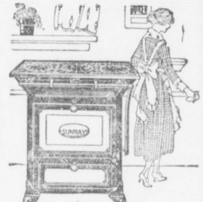
Grande assortimento di stufe a gas e carbone di tutti gli stili

RAPPRESENTANTI DELLE MIGLIORI CASE DI VITROLA, PIANI E PIANOLE CHE SI VENDONO ANCHE A RATE SETTIMANALI