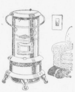
Stufe ad Olio