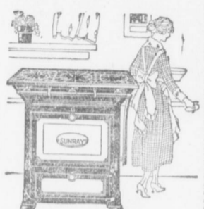
Grande assortimento di stufe a gas e carbone di tutti gli stili

RAPPRESENTANTI DELL'E MIGLIORI CASE DI VICTROLA, PIANI E PIANOLE CHE SI VENDONO ANCHE A RATE SETTIMANALI