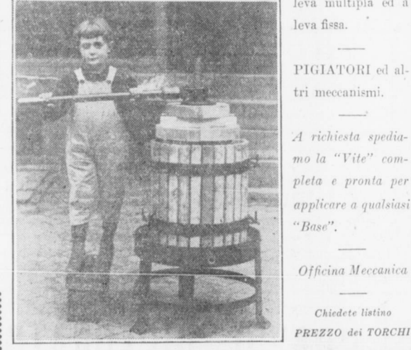
PREZZO DEI TORCHI

FRATELLI BACCELLIERI 924-26 So. 11th St. Philadelphia, Pa.