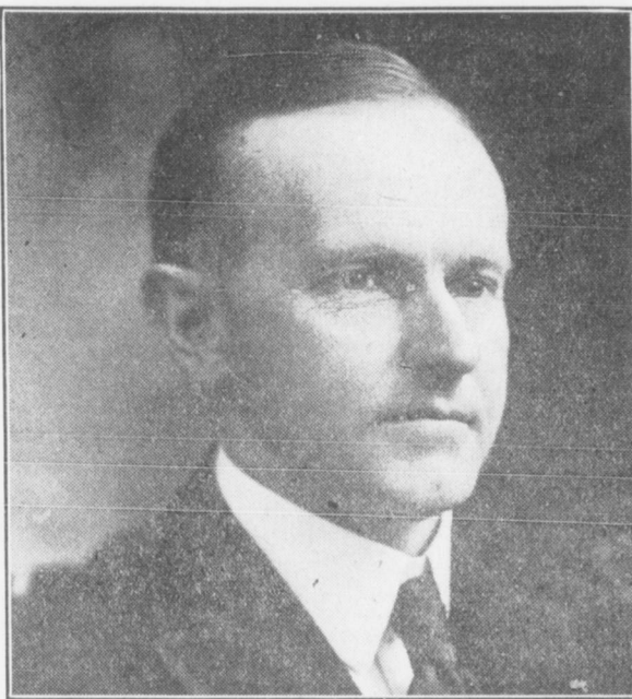
CALVIN COOLIDGE, Governatore del Mass. Candidato Repubblicano a Vice-Presidente degli Stati Uniti