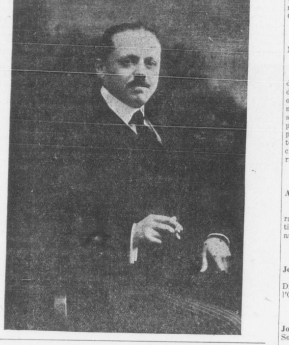
CAV. UFF. GAETANO POCCARDI Console Generale di Philadelphia.

Scranton, Pa., 22 Agosto, 1919 Mayor City of Scranton At opening of State Convention, Scranton Republican, The Scranton Times of Scranton, Pa., e unanimously to send you our sincere